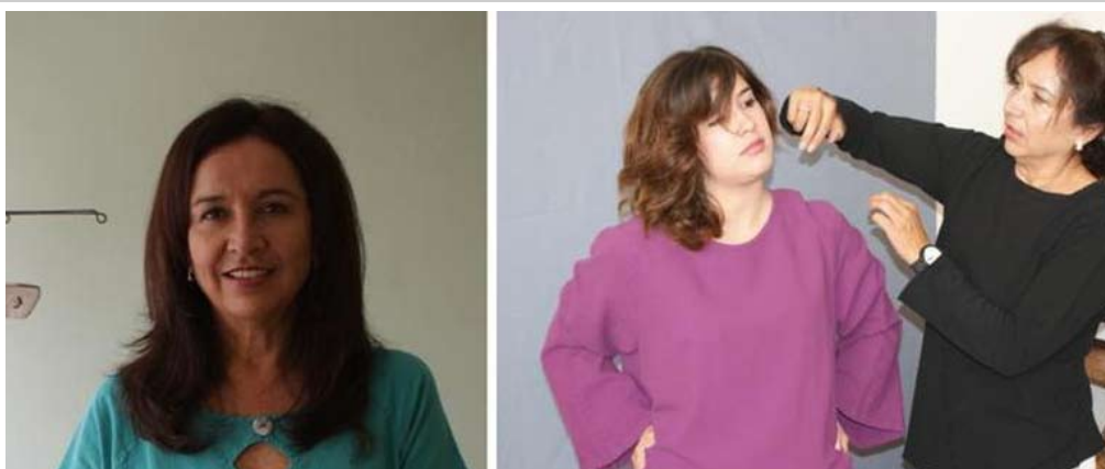
FOJAL, apoyo gubernamental para la gente de todo Jalisco.

Así, quien se atrevió a invertir en otro horno para su panadería, quien pensó en crecer su llantera, quien instaló una peluquería, la costurera que compró una mejor máquina de coser, el chofer que pago su taxi, entre muchos otros, encontraron en FOJAL el apoyo necesario.